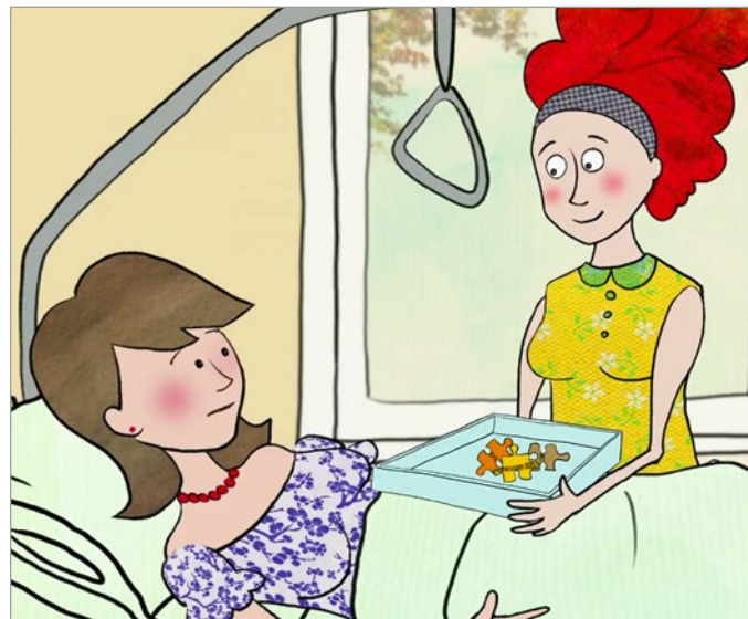
Lotsendienste in Geburtskliniken vermitteln Frühe Hilfen passgenau und frühzeitig.

Die Versorgung von Familien mit psychosozialen Belastungen ist für das geburtshilfliche Personal aufgrund von