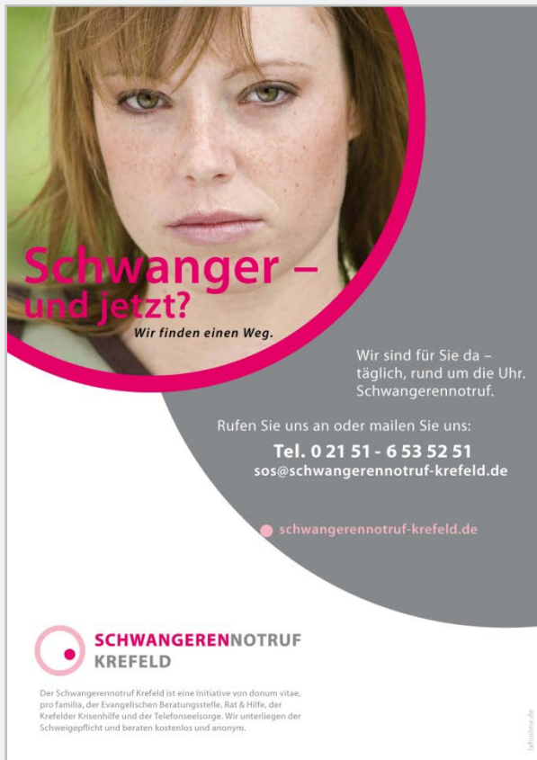
■ Plakat „Sie“