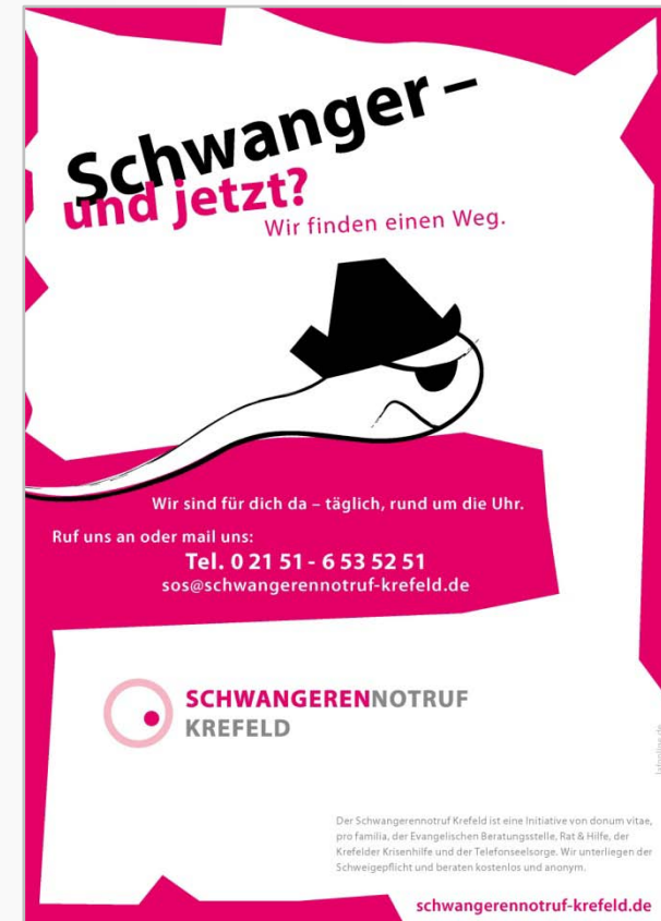
■ Plakat „Pirat“