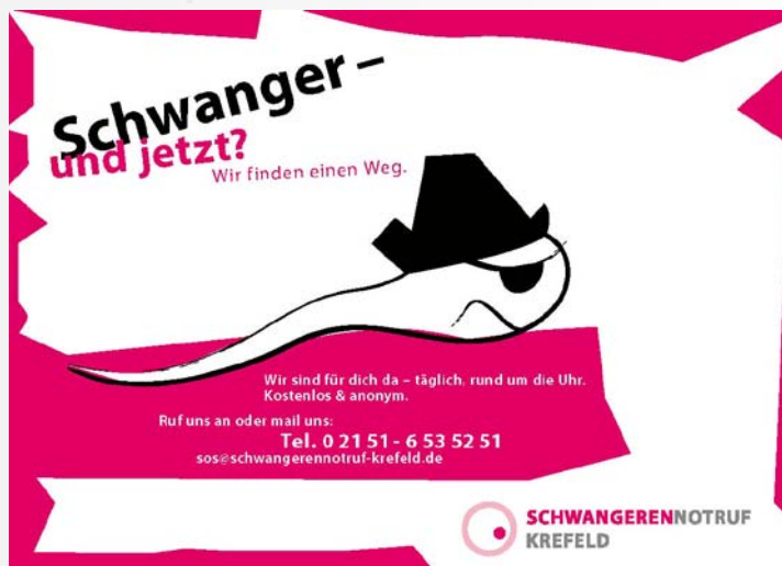
■ Postkarte „Pirat“