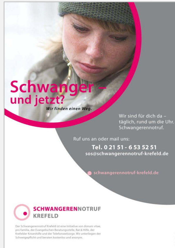
■ Plakat „Du“