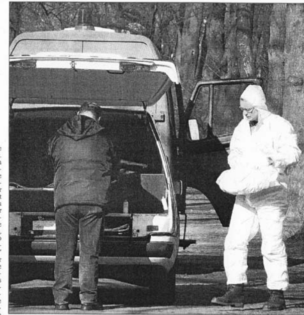
Ein Mitarbeiter des Erkennungsdienstes trägt das tote Mädchen zum Leichenwagen.

Die Polizei bildet zunächst nur eine Ermittlungs- und noch keine Mordkommission. Nach den Ermittlungen durch den Fund des toten Säuglings vor gut zehn Monaten an einem Fußweg zwischen Ritter- und Virchowstraße sind die Beamten vorsichtig geworden. Denn seinerzeit hatte der Gerichtsmediziner zunächst von einem Tötungsdelikt gesprochen; eine Gewebeuntersuchung ergab aber zwei Wochen später, dass der Junge an Geburtskomplikationen starb. Auch sofortige Hilfe hätte ihn nicht mehr retten können, weshalb der Mutter nichts vorzuwerfen war. Die Akte wurde geschlossen, die Eltern nie gefunden.