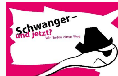
■ Visitenkarte „Pirat“